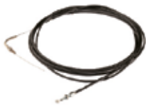
SBLEXT Externe ontkoppelingset