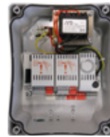
14AB2 Microprocessorbesturing in kunststof behuizing voor 2x 24Vdc aandrijvingen