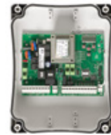
CT202 Microprocessorbesturing in kunststof behuizing voor 2x 230Vac aandrijvingen