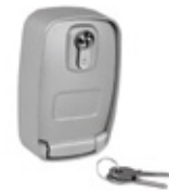
BMET Metalen behuizing met externe ontkoppelingset