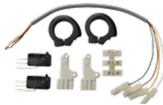
KFE Set eindschakelaars voor SN-50-24