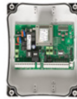
CT202 Microprocessorbesturing in kunststof behuizing voor 2x 230Vac aandrijvingen