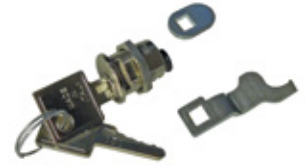
KC Cilinder met sleutel voor noodontkoppeling