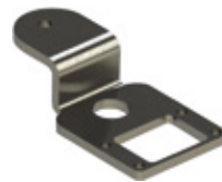
520STAF032A00 Adapterbeugel voor achterzijde naar buiten