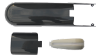
999KRAYD Set kunststof kappen in RAL 7016