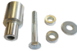
ADWA Adapter voor motoren van andere merken