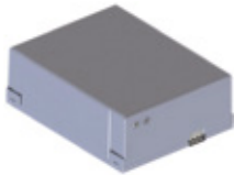
KBP Set noodbatterijen