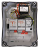
14AB2 Microprocessorbesturing in kunststof behuizing voor 2x 24Vdc aandrijvingen