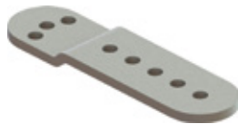
EXRB Montagebeugel voor opening naar buiten