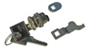
KC Cilinder met sleutel voor noodontkoppeling