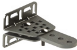
ADR B Verstelbare montagebeugel voor achterzijde (alleen RAY2524)