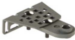
ADF B Verstelbare montagebeugel voor voorzijde (alleen RAY2524)