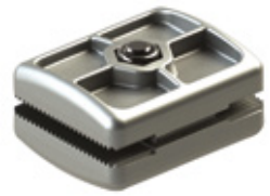
FCRAY Mechanische stop voor sluitpositie