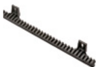
CREM-P Nylon tandheugel (M4) voor schuifpoorten tot 800Kg, lengte: 1.000mm