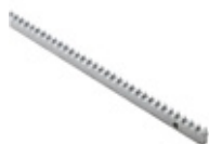
CREM-8 Verzinkt stalen tandheugel (M4|30x8mm), lengte: 1.000mm