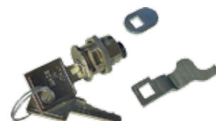
KCS Noodontkoppeling met sleutel