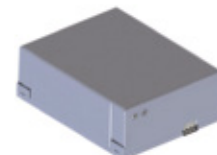
KBP Set noodbatterijen