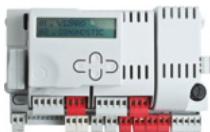
14A Microprocessorbesturing voor 24Vdc aandrijvingen