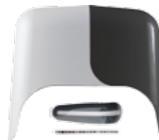
999KSUND Set kunststof kappen in RAL 7016