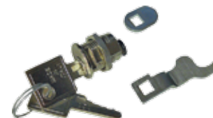
KCS Noodontkoppeling met sleutel